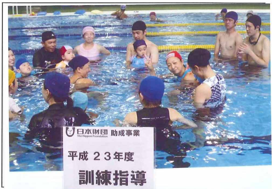
事業の実施状況写真