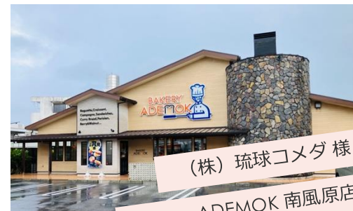
(株)琉球コメダ様 Bakery ADEMOK 南風原店