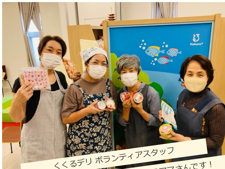
くるりボランティアスタッフ みんな長期付添経験のあるママさんです！