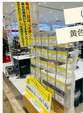
(株)イオン琉球様 黄色いレシートキャンペーン