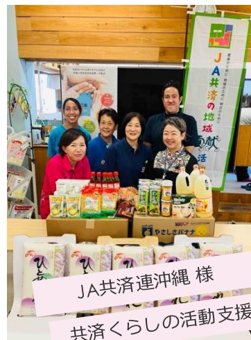
JA共済連沖縄様 共済くらしの活動支援