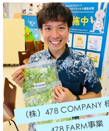
(株)478 COMPANY様 478 FARM事業