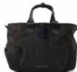
BEAMS GOLF BEAMS GOLF / NSG-NYLON OX --- ¥33,000