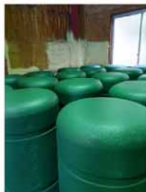
発泡スチロールフロートに一次塗装を行います。