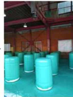
一日間乾燥します。