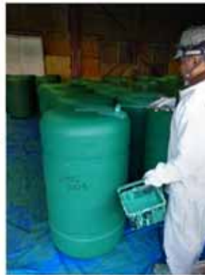
タグを取り付けた箇所を強化する為、二次塗装を行います。