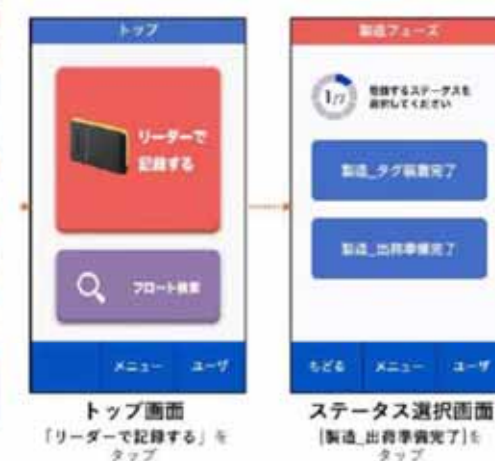
トップ画面 「リーダーで記録する」を タップ