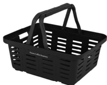
SUPER BASKET SB-465S