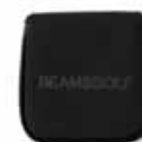
BEAMS GOLF BEAMS GOLF / NSG-NYLON OX --- ¥7,700