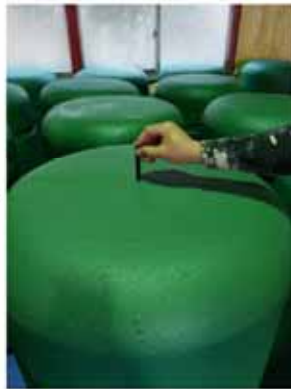
RFIDタグを取り付け、タグのIDを油性ペンで手書きします。 ※タグの取り付け方はP5以降を参照