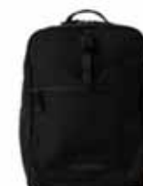
BEAMS GOLF BEAMS GOLF / NSG-NYLON OX --- ¥30,800