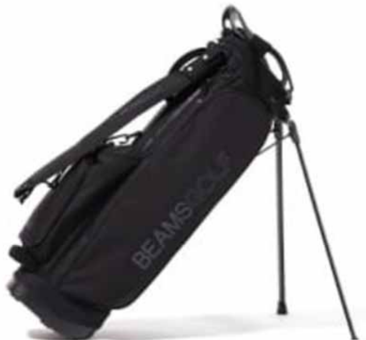
BEAMS GOLF 【ノベルティ対象商品】BEAMS GOLF --- ¥79,200

キャディバッグ、ゴルフ用ボストンバッグやトートバッグ、シューズケース、アイアン・ウッドカバーなどゴルフ用品を13種開発・販売