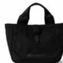
BEAMS GOLF BEAMS GOLF / NSG-NYLON OX --- ¥16,500