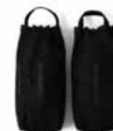
BEAMS GOLF BEAMS GOLF / NSG-NYLON OX --- ¥13,200