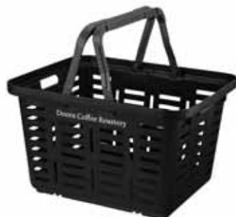
SUPER BASKET SB-370