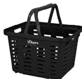
SUPER BASKET SB-310