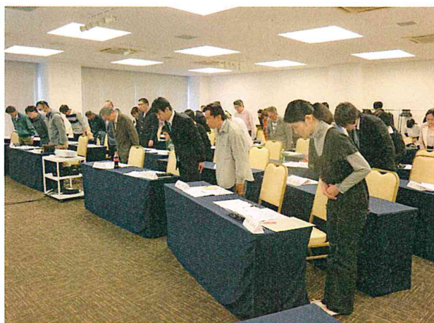
会釈の仕方(1で下げて、2・3で上げる)

前年度までの「販売に係るマナー」に変わり、今年度からは、「職場マナー研修」を開催