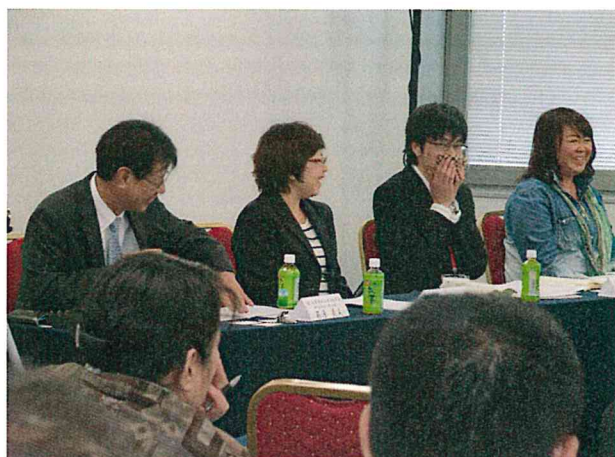
ユーモアを混えた「人を眠らせない」司会