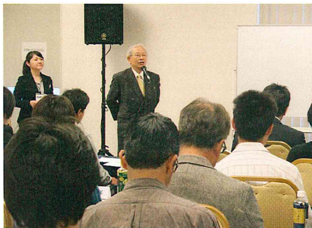
林田会長あいさつ