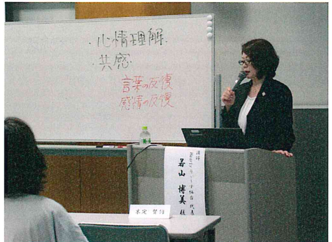
「マナーはルールではなく相手への心遣い」