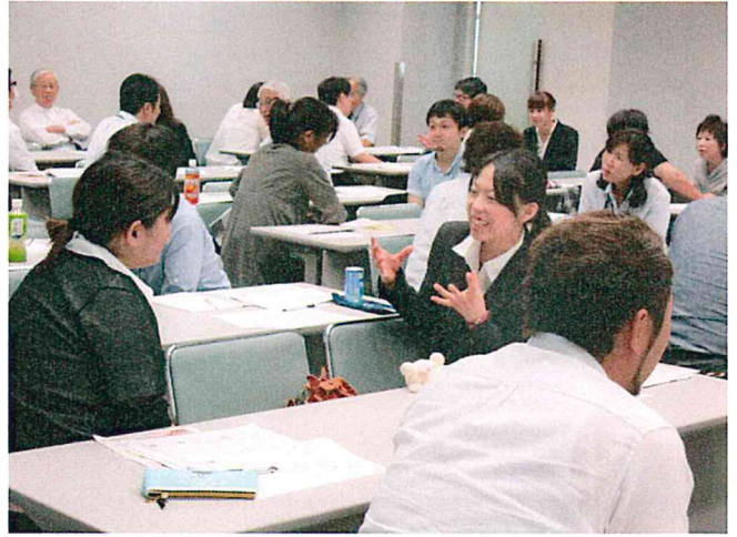
聞き上手は、話し上手、相手の目を見て 話しは結論から話す。