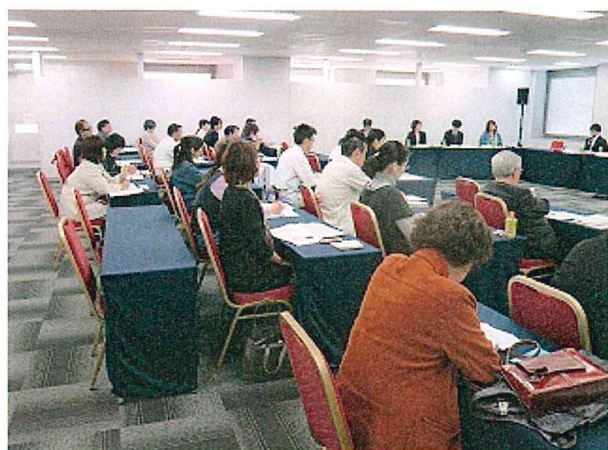
会場で聴講される方も身近な問題として真剣に