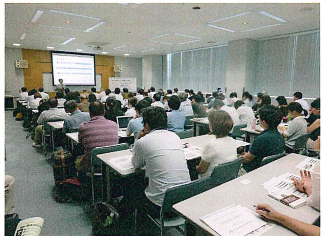
予備席も含め、会場びっしりの聴講者。約110名の参加者が熱心に聴講しました。