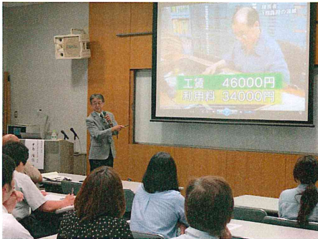
障害者施設の実態を紹介しながらの説明