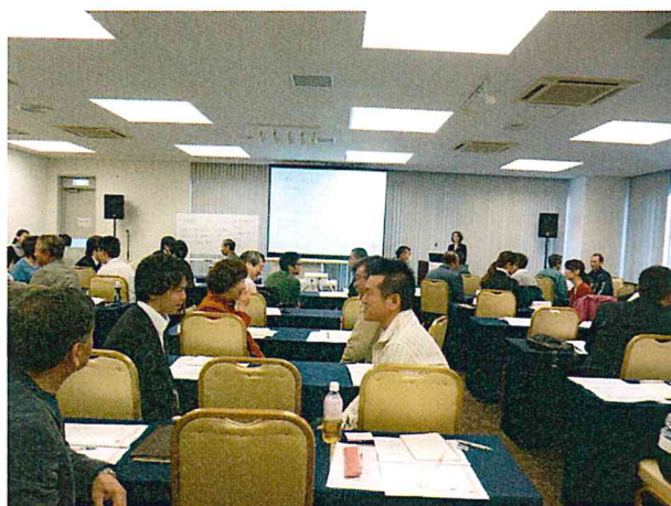
相手の話をしっかり聴く(耳+目+心)練習

「マナーは、ルールではなく相手への心遣い。」「思いやり、相手を敬う気持ち」です。ビジネスマナーは、コミュニケーションの潤滑油、人と人を結びつける「信頼関係」への最初の一歩だと、教えていただきました。改めてマナーを勉強して、忘れかけていたことを改めて確認させていただきました。