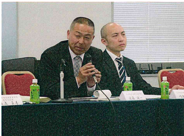
教育現場からの貴重なご意見も

宮城労働局からの障がい者雇用の現状説明の後、障がい者就労に関わる関係者による活発な意見交換が行われ、基調講演の陞本様からは適切なアドバイスをいただきました。