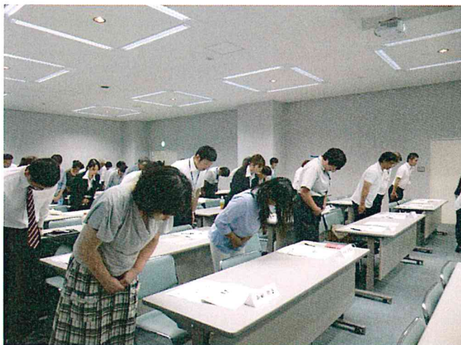
お辞儀は「先言後礼」 これは、45度で最敬礼？