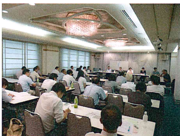
発言者の体験談は大変参考になりました。