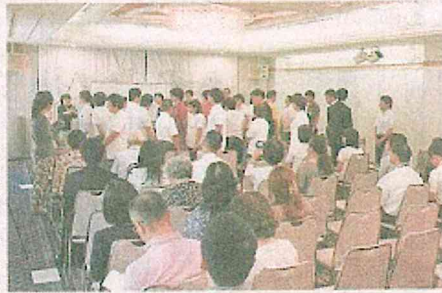
2人一組で接客用語を練習した研修会

障害のある人とその家族らが就労に関する知識、技術を学ぶスキルアップ研修会（NPO法人福祉ネット）が6日、岡山市で開かれ、約200人が参加した。 社会事業団など共催で、約200人が参加した。 職場マナーを学ぶ研修では、接客時のあい