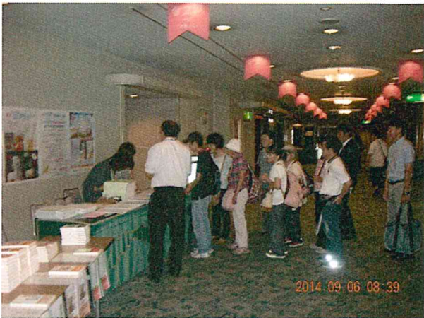
受付風景、物凄い長蛇の列が...