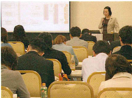
報酬改定をまじかに控えた制度設計の動向など……。