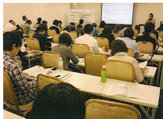
約80名の参加者が、熱心に聴講しました。