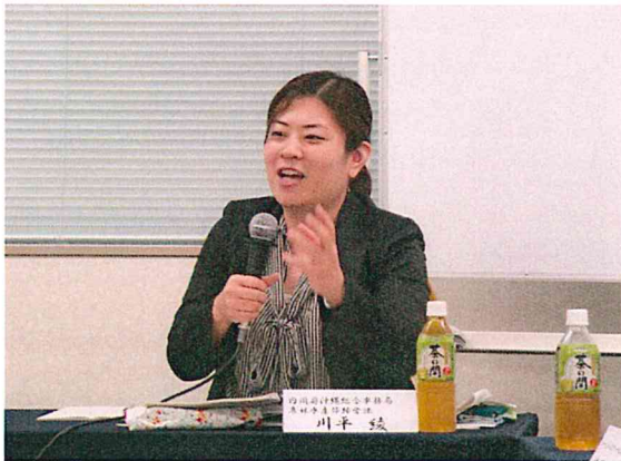
遠く沖縄からの参加も(農水行政)