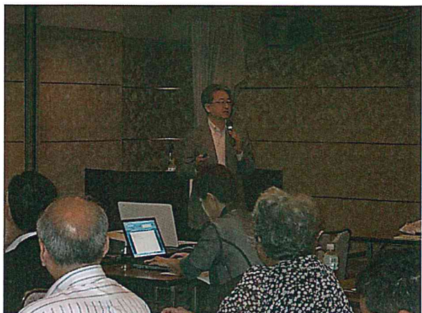
実例を挙げ、分かり易く教えていただきました。