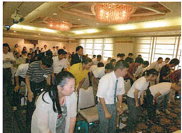
聴講者を含め約100名の参加者が、お辞儀の仕方などを勉強しました。