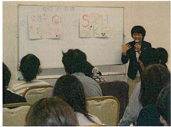
S(~さん)、K(敬語)、H(品格)が大事！ 参加者は、メモを取るなど、真剣に受講しました。