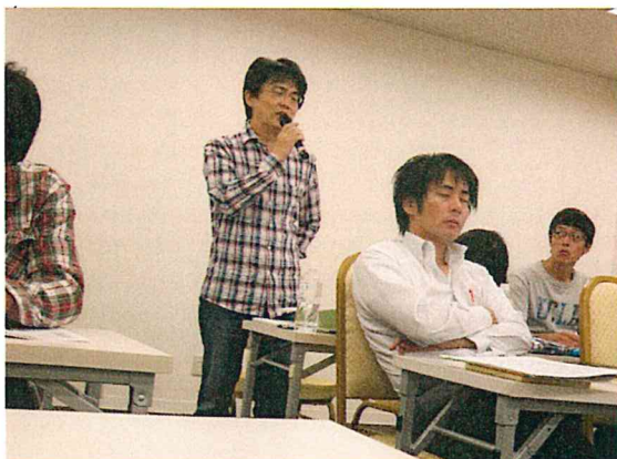
聴講者も飛び入りで意見交換