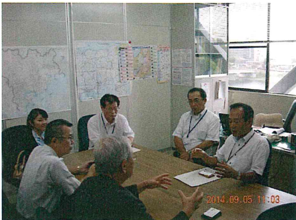
共催・後援いただいた関係先へごあいさつ

岡山県での開催は、今回で4回目。総社市で1回、ここ岡山市では3回目の開催になりました。