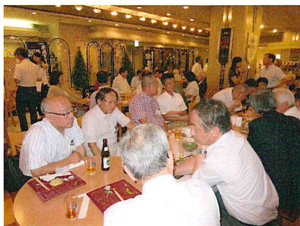
交流会は、講演で質問できなかったことや意見交換など、和やかで有意義な時間に。