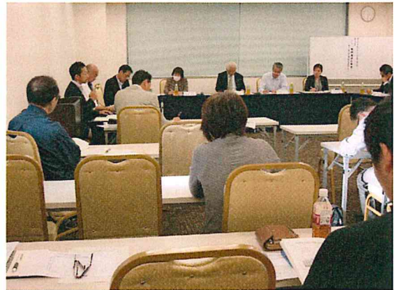
実践を踏まえた説得力のある発言に、30名の聴講者も思わず納得。