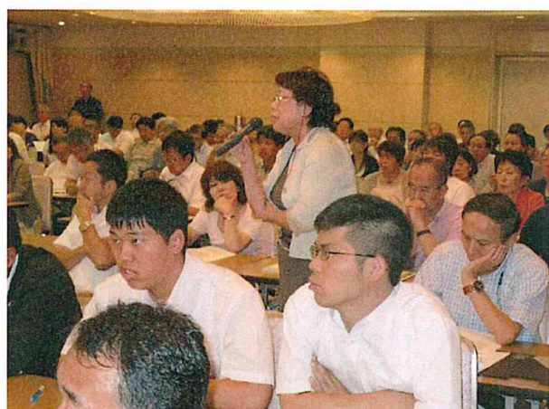
会場からは、熱心な質問、要望が多数ありました。