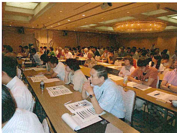
約200名の参加者が、熱心に聴講しました。