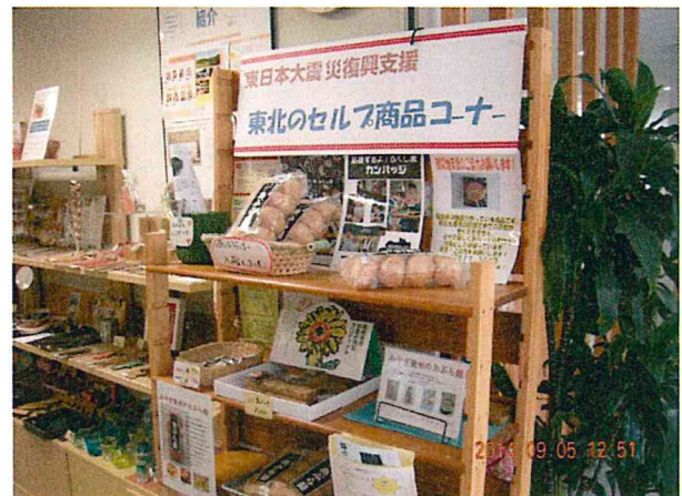
岡山県社協様には、セルフ商品コーナーもあり、障害者就労の力強い後押しが見れました。