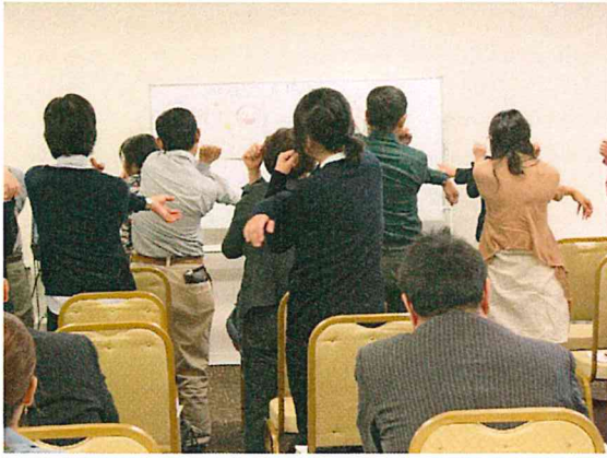
まずはストレッチをして身体をほぐしてから。