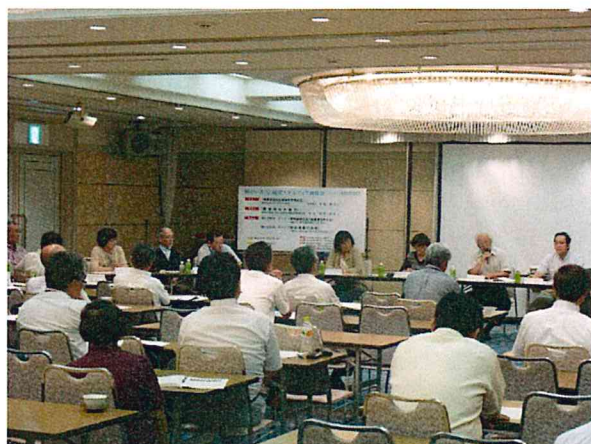
アドバイザーからは辛口のアドバイスも。