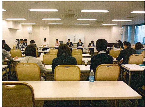
34名の方が、意見交換・聴講しました。