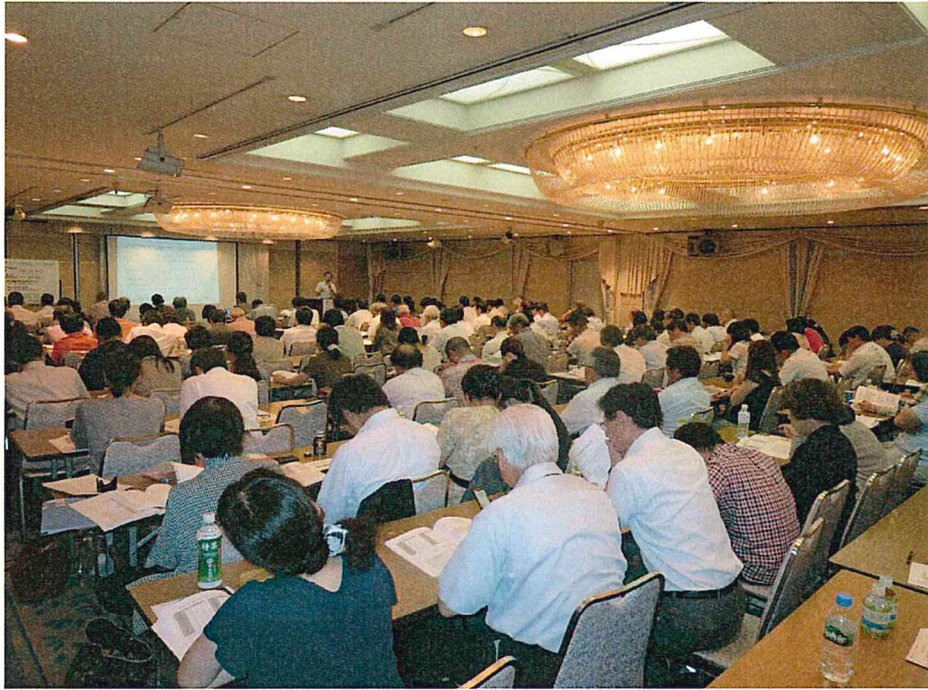
第3回 岡山会場（平成26年9月6日）

障がい者(児)就労スキルアップ研修会 事務局 (特定非営利活動法人 福祉ネットこうえん会 本部)