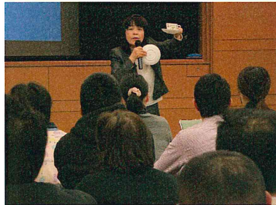
お茶出しの作法も