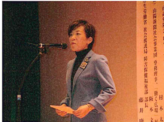
ご来賓 厚生労働副大臣 山本かなえ氏