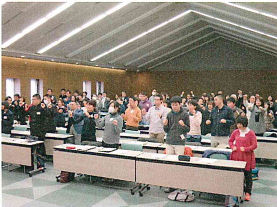
まずは、体ほぐしの体操から、聴講者も一緒に「1・2・・・」