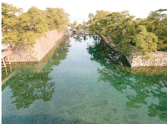
高松城(玉藻城)内堀は珍しい海水