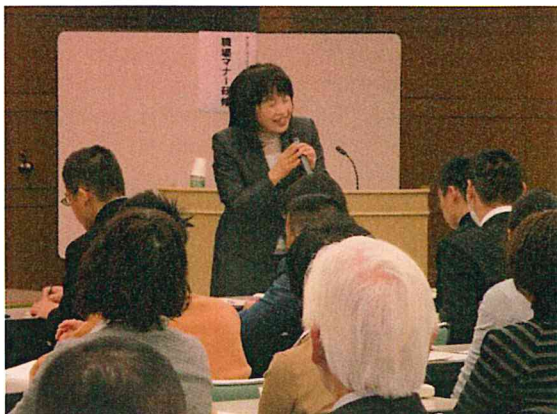
一人ひとりに話しかけながら