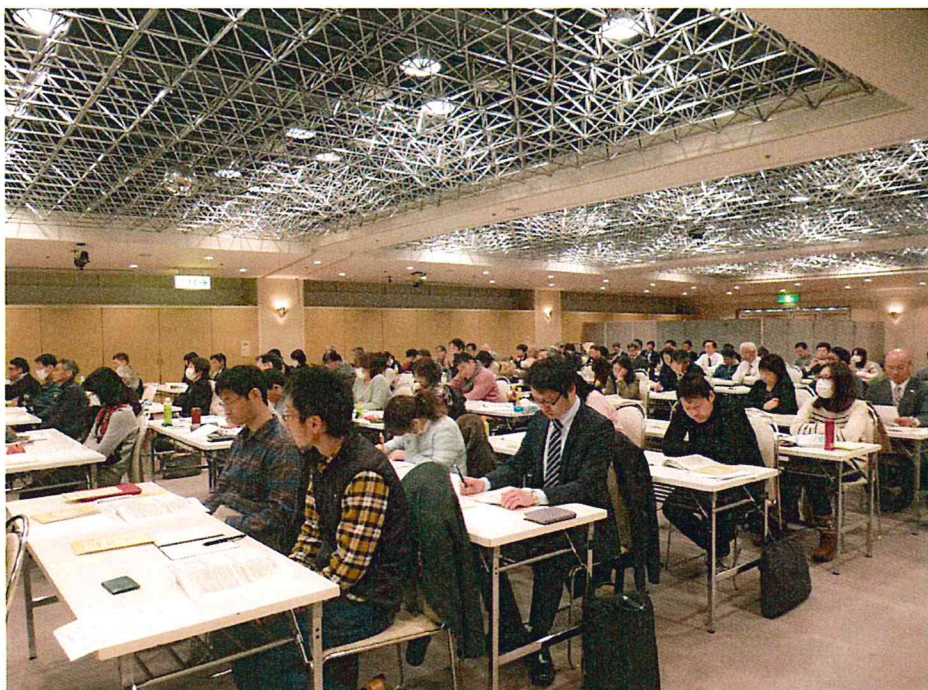
第6回 浜松会場（平成27年1月31日）