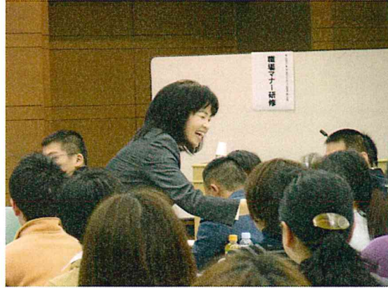
笑顔は基本中の基本:先生も実践