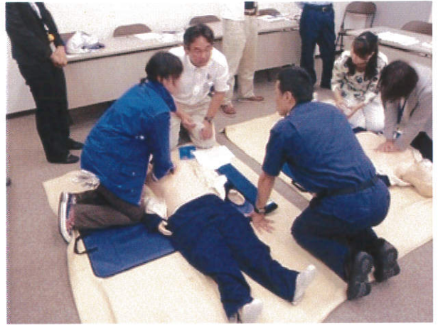
心肺蘇生実技講習