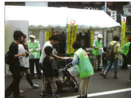
6月29日(日) 八戸：ホコ天