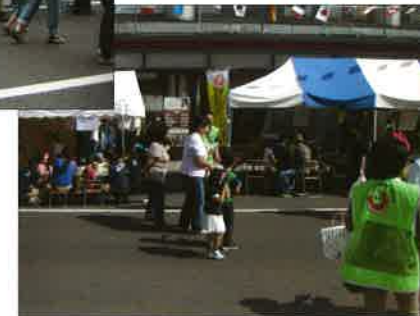
9月28日(日) 弘前：カルチャロード