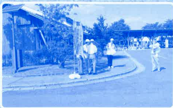
遊学会まつりキャンペーン 平成26年9月28日(日) 於 遊学会