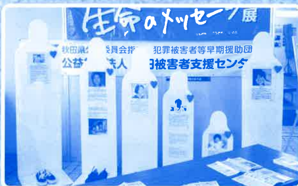
生命のメッセージ展 平成27年1月25日(日) 於 秋田県警察運転免許センター