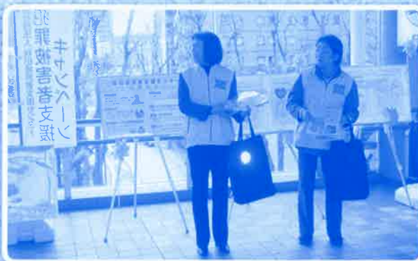
「世界道路交通犠牲者の日」キャンペーン 平成26年11月16日(日) 於 ぼぼロード