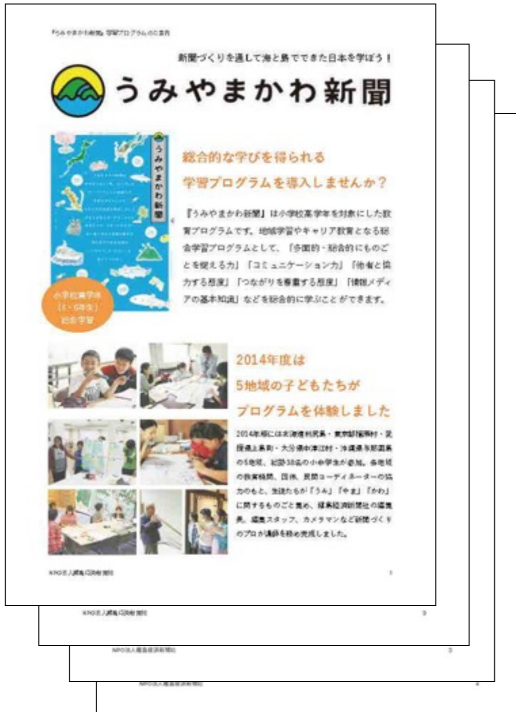
プログラム詳細資料