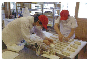
天然酵母パン ゆいまーる

自家製の天然酵母を使った国産小麦のパンを中心にお菓子を作っています。併設の「カフェカンパーニュ」は焼きたてのパンを使ったオリジナルメニューとコーヒーなどのドリンクを提供している小さなギャラリー風カフェです。