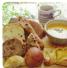
カフェ カンパーニュ