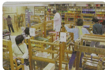
オリジナルブランド「ぱた」 手織り・手紡ぎ・フェルト・紙すき・染め