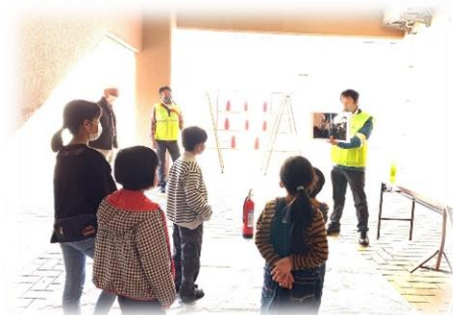
イザ!カエルキャラバン!