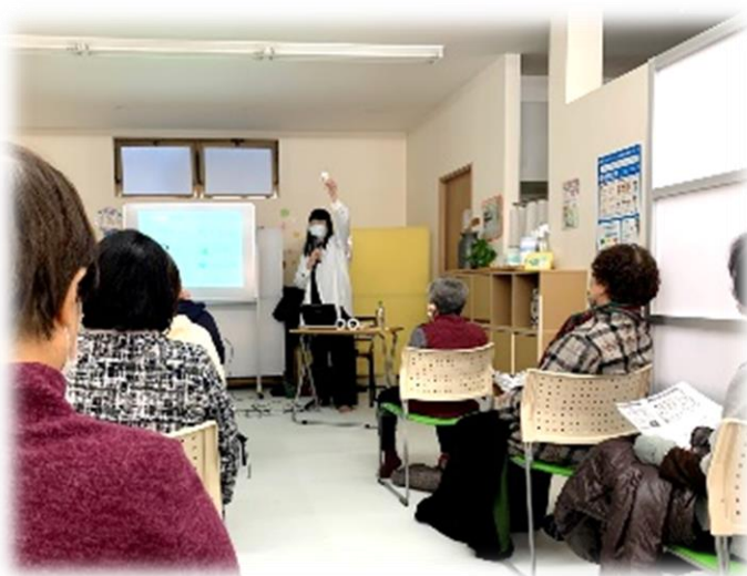
子どもの育ちや発達障がいについて