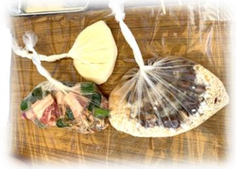
親子防災「親子でポリ袋クッキング」