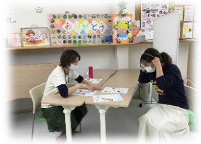
セルフヘッドマッサージ