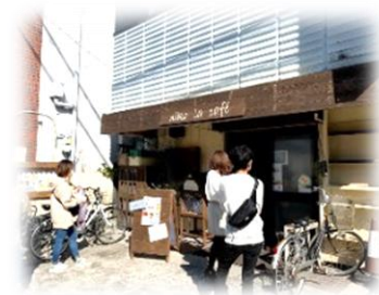
SUCSEE(シュクセ)一日限りのケーキ屋さん

☆おたがいさんサロン 毎月第4木曜日 13:00~15:00 (新型コロナウイルス感染拡大防止により中止) ☆ニコラ食堂 毎月最終火曜日 17:30~ (今年度は6/30と10/27) ☆やんちゃま食堂お弁当作り 毎週木曜日 14:00~ ☆おやこ食堂お弁当作り 毎月最終土曜日 15:00~ ☆イベント出店 3/20 (土) 親子まつり プレーンマフィン 30個販売