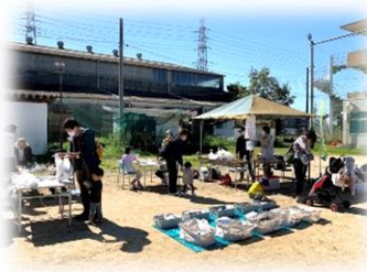
ネイチャーアート