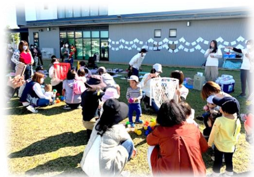
←「コロナに負けないじょ！ NIKO ミニ運動会Ⅱ」

講習会では密にならないよう組数を減らしての開催とし、毎回新型コロナウイルス感染拡大防止に徹した。全てのイベントにおいて早い段階で募集人数に達した。9月に開催した「親子防災」の講座は、近年自然災害が起きている影響で、取り上げられる機会も多い話題だけに関心をもたれるママが多く好評だった。10月の運動会は、雨天時でも室内で開催できるように場所もおさえていたが、当日は晴天だったので芝生で開催することができた。