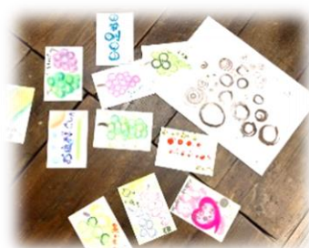
絵文字アート work shop