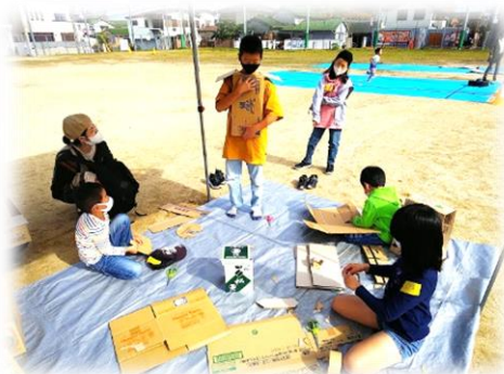
ダンボールで工作