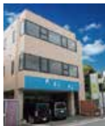
お菓子工房はあもにい

半径20キロ圏内に 真のノーマライゼーション社会の構築を目指し みんなが幸せを感じられる街を次世代に残すために 「はあもにい」は活動を続けていきます。