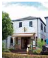
Community Cafe ｂ