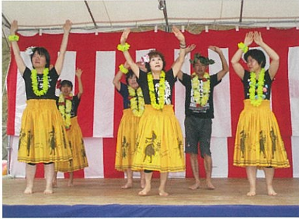
フラダンスクラブ