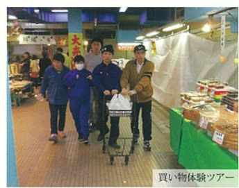
買い物体験ツアー

日常生活において、身体を動かし、楽しく食事をする。ゆったりとお風呂に入る。そんな身近にある幸せを、自分らしいスタイルで送れるように、スタッフがお手伝いさせていただきます。ご自分の「家」のように振る舞っていただけるよう、「お帰りなさい」と声を掛けたり、アットホームな雰囲気をご提供いたします。