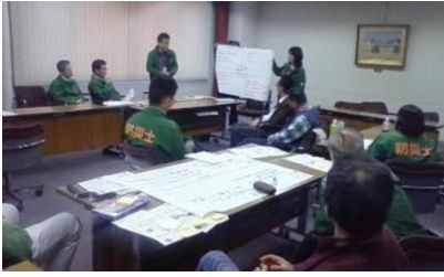
25・3・23 岐阜県支部 2月に発表された岐阜県の地震被害想定調査結果を踏まえスキルアップ研修を実施した。