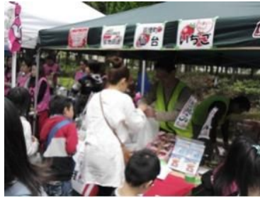
24・5・12 千葉県支部が千葉市内自治会との共同で被災地の磁場産業復興支援を目的に、宮城県亶理町の特産品「いちご」を亶理町から送ってもらい、即売会を実施。市民の皆様へ復興支援を呼びかけた。