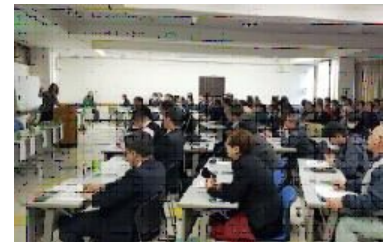
25・3・2 東京土建世田谷支部会館において、世田谷区支部、宮城県支部、東京都支部の共催で「防災と被災地復興支援の集い」を開催した。