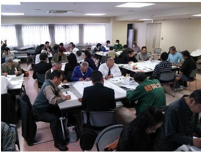
25・3・30 兵庫県支部 DIG・避難所開設に関する指導者研修会を実施した。