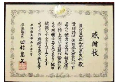
25・3・11 東日本大震災被災地支援の貢献が評価され、和歌山県支部が厚生労働大臣より感謝状を授与された。