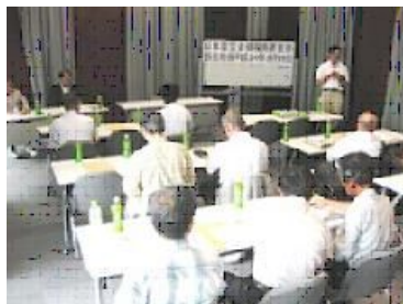
24・8・18 福島県支部 が設立された