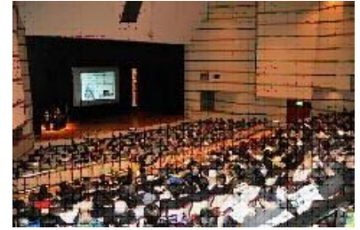
25・2・3 兵庫県支部が「防災士シンポジウムin HANSHIN」を開催。阪神地域自治体、防災関係機関、防災士など700名が参加した。