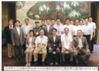
愛知県支部が愛知県の大村知事を表敬訪問 自治体との連携強化を進めるために、自治体のトップや防災責任者と意見交換することが重要です。