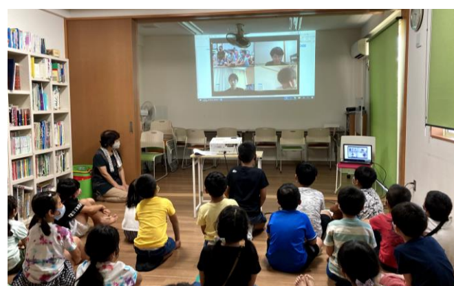
日福大サービスラーニング リモート活動