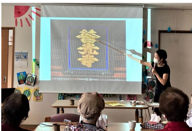
デイサービス仮想バスツアー