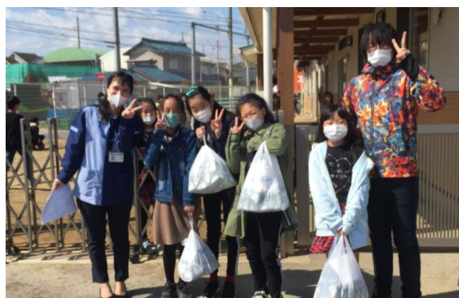
ローソン「学童保育施設おにぎり無料配布」