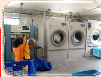
クリーニング事業