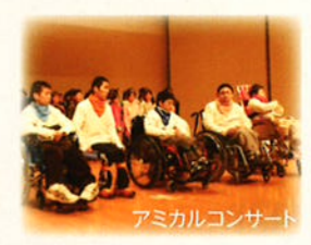
アマカルコンサート