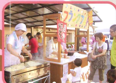
地域の方と夏祭り