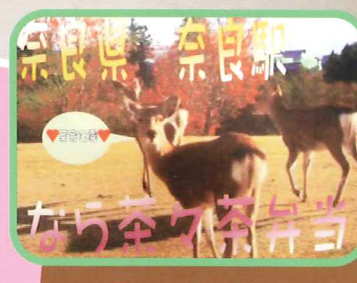
大好評の全国駅弁シリーズ！