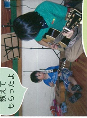
ギター 教えて もらったよ