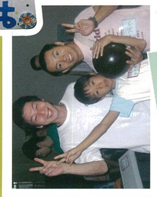
高梁の福祉を考える会