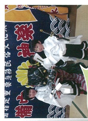
子どもたちは 備中神楽が大好き