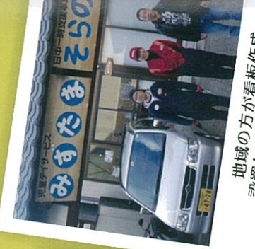
地域の方が看板作成 設置してくださいました