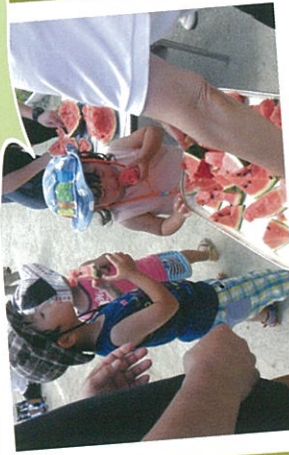
夏まつりのすいか割り