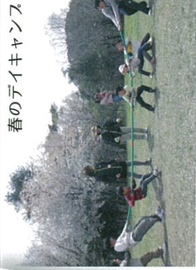
春のデイキャンズ