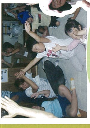
みんなで調理も たくさんしたよ