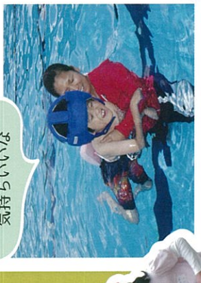
スールは冷たくて 気持ちいいな