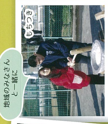
地域のみなさんと 一緒に