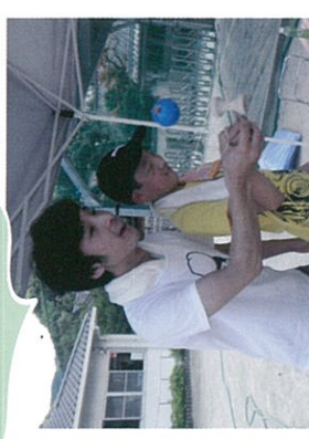
けん玉のお兄さんと 一緒にできた！