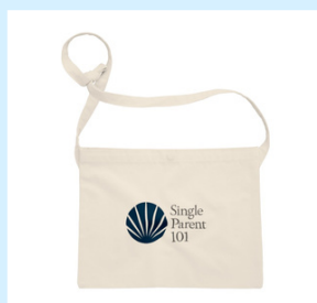
サコッシュ ¥2,838 (税込)