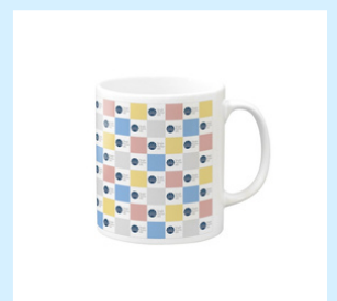
マグカップ ¥2,354 (税込)