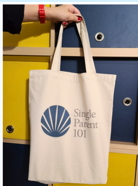
トートバック ¥3,190 (税込)