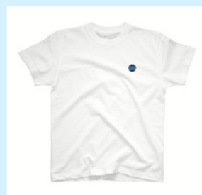
ロゴ入りTシャツ ¥3,344 (税込)