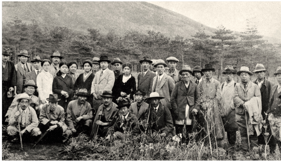
東富士は日本の自然保護運動の先駆けの地 第一回探鳥会 1934年

日本の自然保護運動の先駆けといわれる第一回探鳥会は私たちのふるさと東富士で行われました。野鳥の種が多いことは生物多様性の豊かさを物語っています。