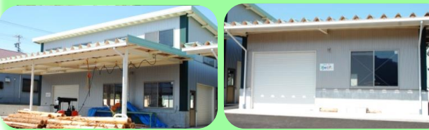
製材・木工製品製作所