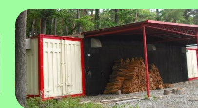
伊那公園林 薪小屋