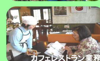
カフェレストラン業務