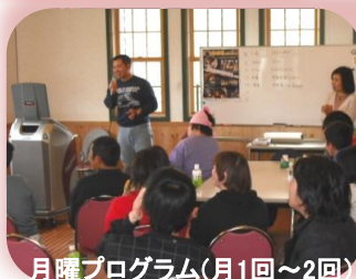
月曜プログラム(月1回~2回)