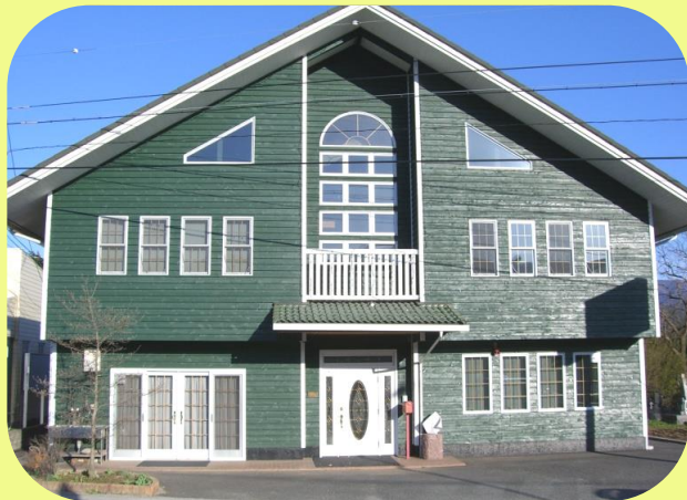
アンサンプル松川第Ⅰ 平成14年4月開設 定員30名