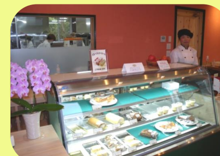
パティスリーアンサンプル