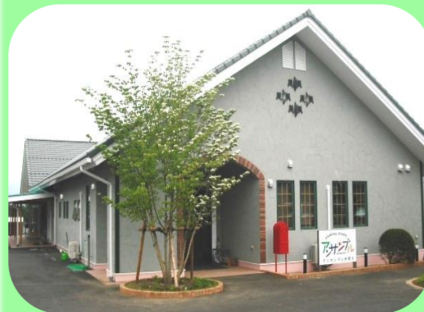
アンサンプル伊那第Ⅱ (多機能型施設) 平成25年4月開設 定員40名