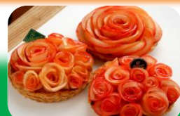
大好評ローズパイ