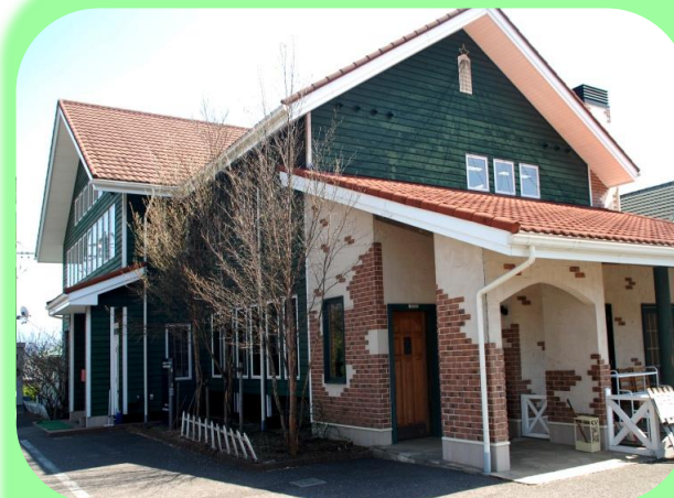
アンサンプル伊那第Ⅰ (多機能型施設) 平成17年5月開設 定員40名