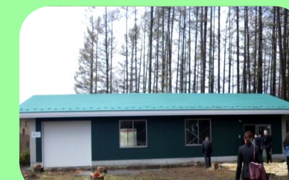
伊那公園林 薪作業棟