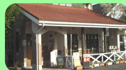
カフェレストラン