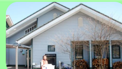
重症心身障害者専用棟