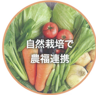
自然栽培で農福連携

耕作放棄地を利用し、無農薬・無肥料の自然栽培を行います。食べるだけでなく耕作も安心・安全です。また、障がい者だけでなく、高齢者、就労困難者の働く場を生み出すことを目指しています。栽培だけでなく、作物の二次加工、そして販売も含めて、さまざまな仕事を生み出します。農業と福祉を連携させ、地域に活力を生み出し、人のつながりの再生にも努めます。