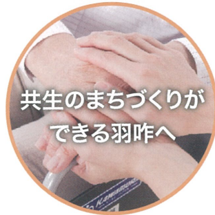
共生のまちづくりができる羽咋へ

耕作放棄地を利用し、無農薬・無肥料の自然栽培を行います。食べるだけでなく耕作も安心・安全です。また、障がい者だけでなく、高齢者、就労困難者の働く場を生み出すことを目指しています。栽培だけでなく、作物の二次加工、そして販売も含めて、さまざまな仕事を生み出します。農業と福祉を連携させ、地域に活力を生み出し、人のつながりの再生にも努めます。