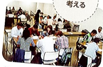
地球温暖化防止活動推進員の研修会