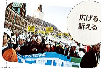
2009年デンマークで行われた気候変動 条約に関する国際会議にNGOとして参加