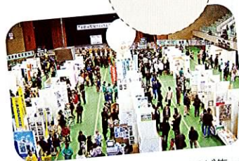
100以上の団体と4000人の市民が集った 和歌山環境フォーラム2005