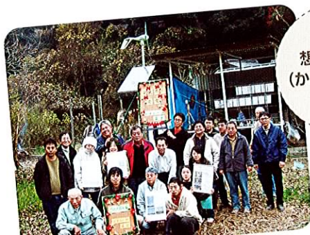
紀州えこなびと (会員団体) が ピオトープ孟子に 風力発電機を設置