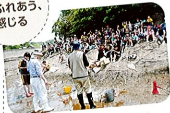
天神崎の自然を大切にすの会 (会員団体) による海の生きもの観察会