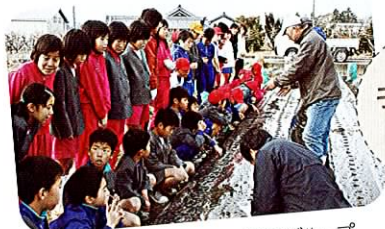
紀の川市環境保全型農業グループ (会員団体) による食と農の体験学習