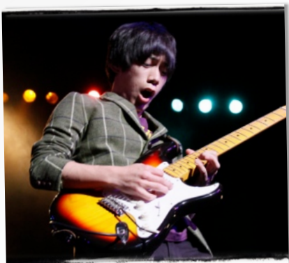
高校バンドの祭典