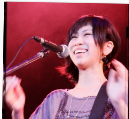
全12バンドが本選に！