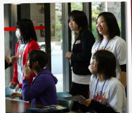
実行委員の高校生も大活躍！