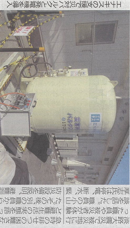
能登半島地震や阪神・淡路大震災で被災地に行き交った。被災事業者の充填機などの復旧支援に9億5千万円を計上した。被災事業者の充填機などの復旧支援に9億5千万円を計上した。

被災事業者の充填機など復旧支援 被災事業者の充填機などの復旧支援に9億5千万円を計上した。被災事業者の充填機などの復旧支援に9億5千万円を計上した。