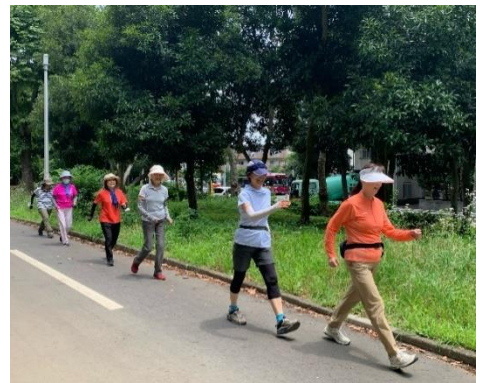
美・姿勢ウォーキング

背筋が伸びた スマホ巻き肩・肩こりが改善した 気持ちが前向きになった 膝・腰の痛みが減った 体力がついた 歩幅が大きくなった 転倒しなくなった