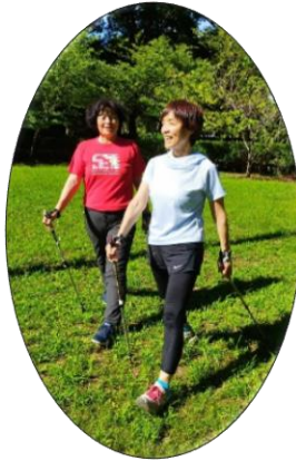
2本のポールを使うウォーキング