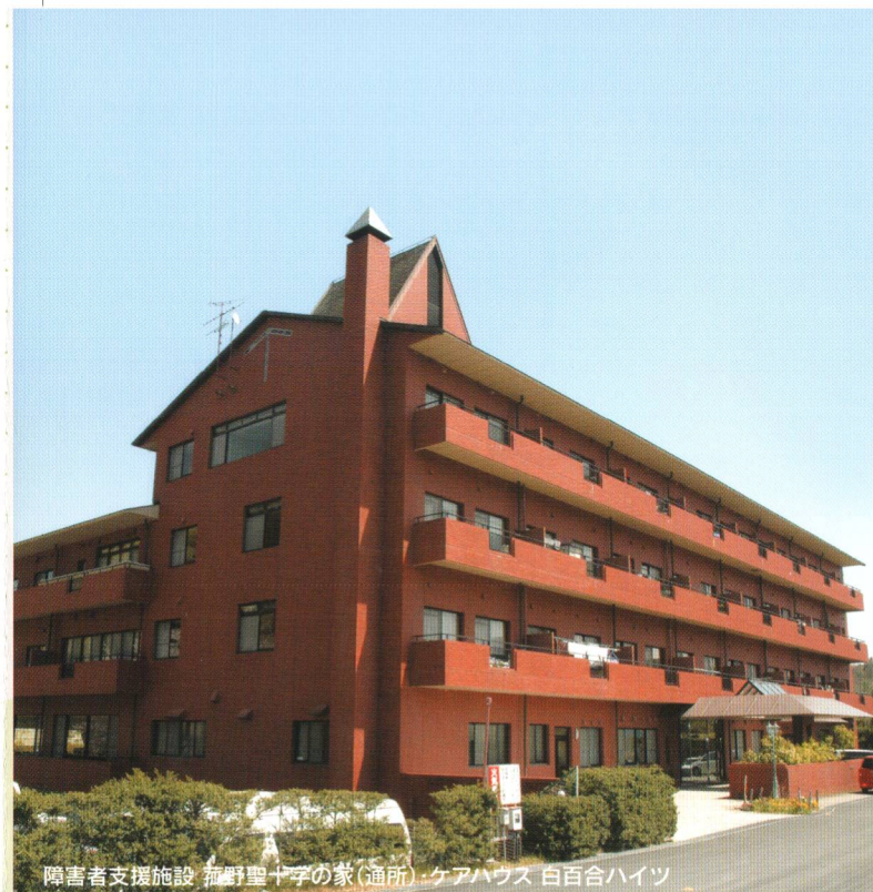
障害者支援施設 菰野聖十字の家(通所) ケアハウス 白百合ハイツ