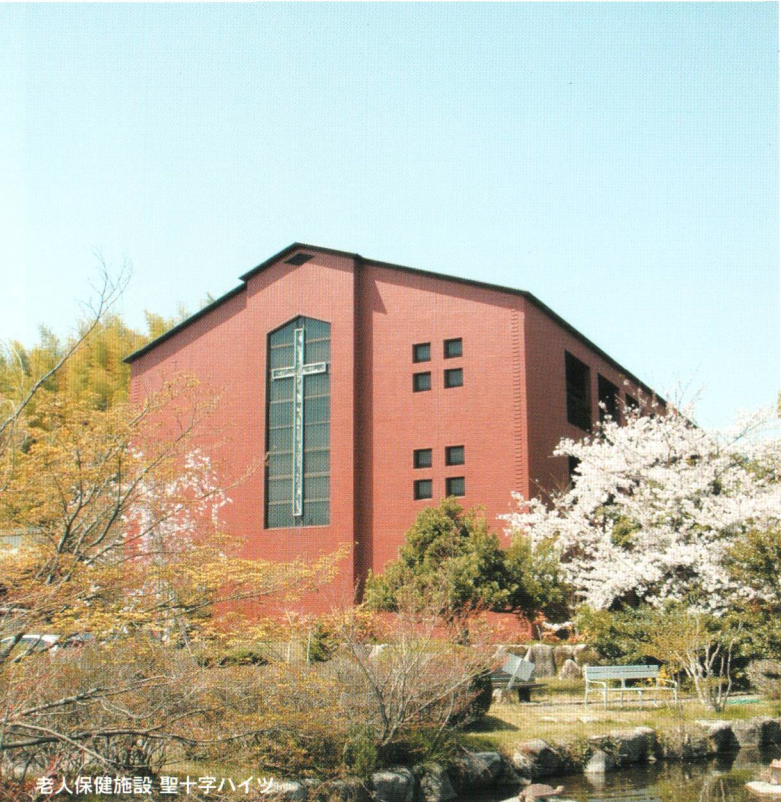
老人保健施設 聖十字ハイツ