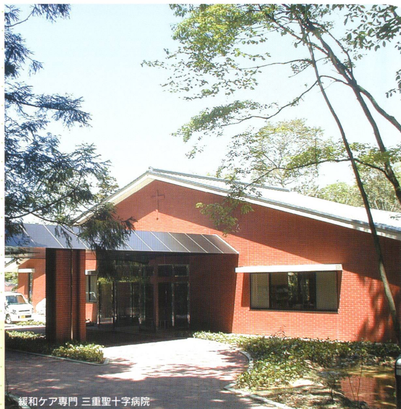
緩和ケア専門 三重聖十字病院