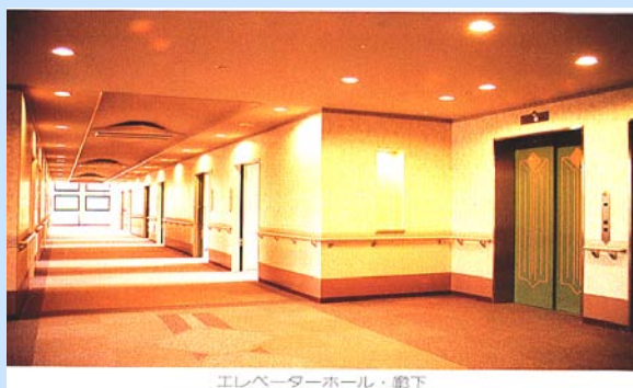
エレベーターホール・地下