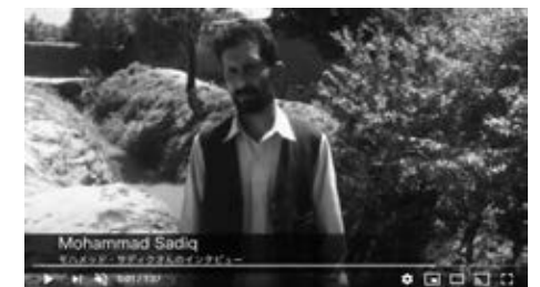
ゆめポッケを受け取ったお子さんの親御さんのインタビュー Interview with the parent of a child who received a Dream Bag

子どもたちには学校に行って将来は医者か、エンジニアになってほしいです。文字の読めない人にはなってほしくないです。ゆめポッケ事業について感謝しています。私たちへの支援を続けていただければ幸いです。いつか私たちが他の人々を支援することができるように。