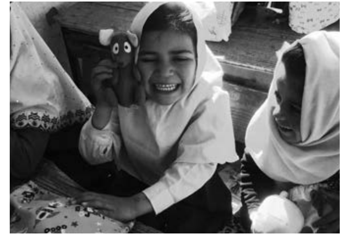
ゆめポッケを受け取り喜ぶ女の子 A girl who is pleased to receive a Dream Bag.

2019年はアフガニスタン全土で治安がさらに悪化し、タリバンとアメリカとの和平交渉は進展せず、両者が戦闘を繰り返しました。その結果、多くの方がアフガニスタンで命を失いました。国連人道問題調整事務所の報告書によると、2019年だけでアフガニスタンでは、43万7千人の人々が新たに避難を余儀なくされ、その避難先の多くが、貧困や長引く干ばつやその他の自然災害の影響を受けて困難にあえぐ地域であったと報告されています。しかし、一時中断していた和平交渉は、2019年11月カタールにて再び開始されています。このような状況の中、2005年から継続しているゆめポッケ配布事業を4月に実施しました。パルワン州チャリカ地区の17校4,157名の低学年の子どもたちにおもちゃや文具を配布しました。