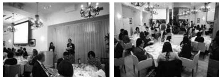
シャトー ラグランジュ チャリティワイン会の様子 The Chateau Lagrange Charity Wine Party.

By November, another long-awaited task was completed; the conversion of the website, as well as the installment of a customer management tool on Salesforce in order to fully transfer the data. For the BOOKMAGIC project, we raised 1,773,438 yen from book donations from 400 participants, and raised 745,436 yen from 385 participants for the Fashion Charity Program. From next year, we will further develop and strengthen the PR for these projects to attract more participants.