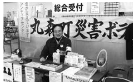
ボランティアセンター受付業務に従事するジェンスタッフ JEN staff working as a receptionist at the Volunteer Center

JEN staff were stationed at the Disaster Volunteer Center in Marumori town, sending the volunteer staff to respective families according to their needs, such as house cleanup and mud-raking. JEN staff also helped to complete tasks themselves, to build greater trust with residents.