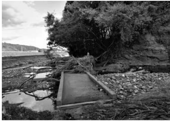
台風被害の時の様子 State of the typhoon damage

2015年から始まった東北フェーズIIプロジェクトは、4月までに事業を終了し、5月に外部評価を行いました。同評価では、ジェンが復興で取り残されがちな人々に配慮し、福祉・若者育成に従事する地元団体への中間支援にジェンが注力した意義が確認されました。その一方で、東北被災地では貧困・少子高齢化が更に進み、今後、地域住民を主体とした長期的な取り組みが必要であることも再認識しました。評価結果を受け、新フェーズの事業形成のため、岩手県、福島県、宮城県で活動する団体及び自治会の担当者からのヒアリングを実施し、さらに具体的な事業形成のための詳細調査を今後実施する予定です。10月からは、台風19号により甚大な被害を受けた宮城県伊具郡丸森町で、災害ボランティアセンターの運営支援を開始しました。丸森町では、未だに1000世帯以上が在宅で避難をされており、272世帯以上が仮設等で生活されています。今後も、ジェンは、住民の皆さんが主体的に課題を解決し、より良い復興に取り組めるように、支えていきます。