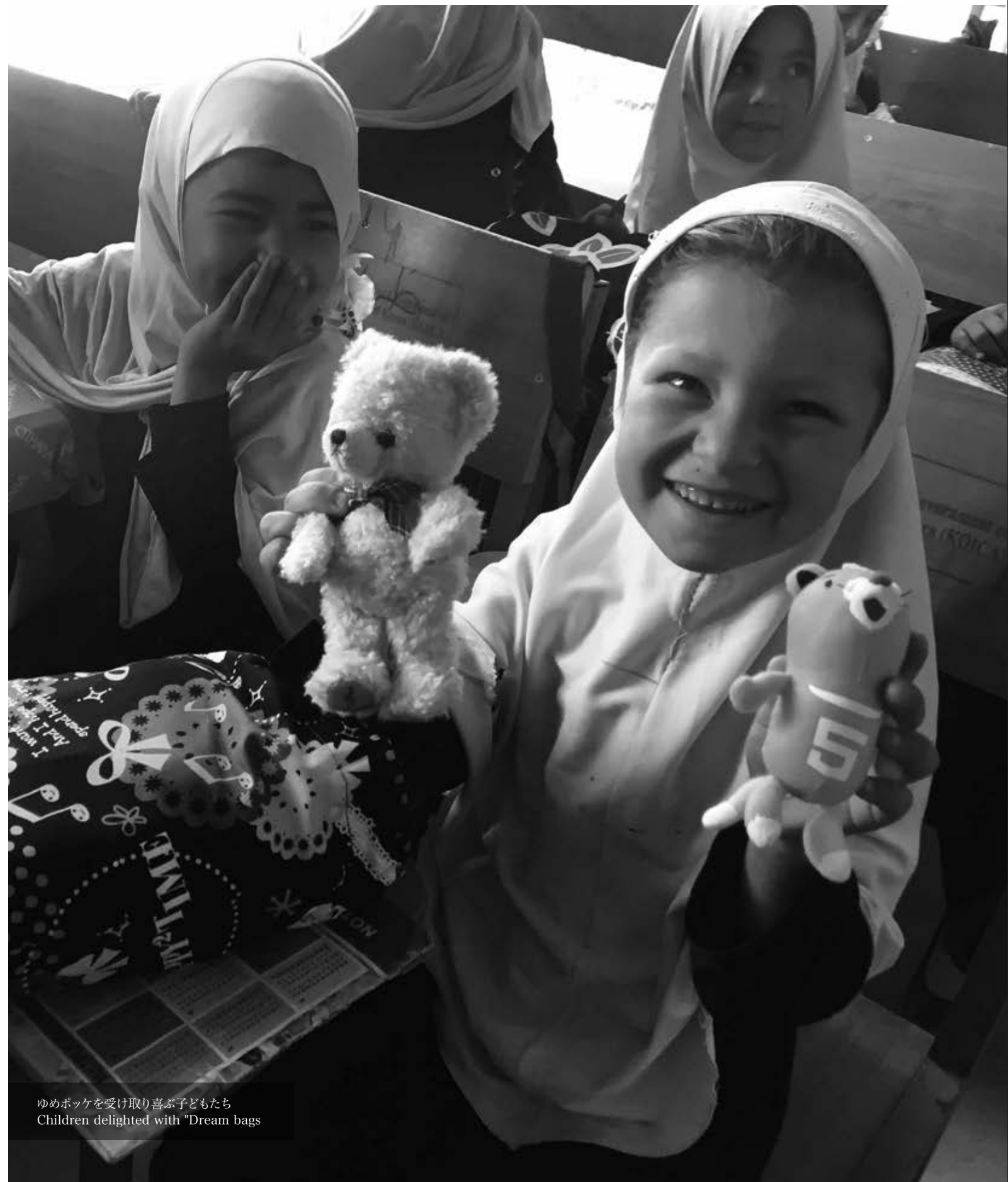
ゆめポッケを受け取り喜ぶ子どもたち Children delighted with "Dream bags"