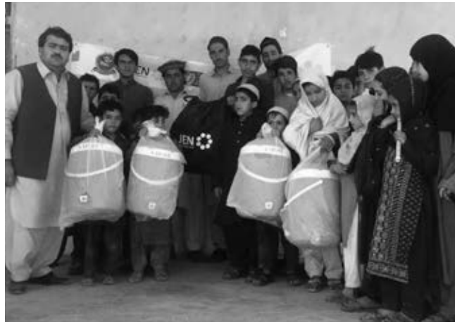
衛生キットを配布時の様子 Hygiene kits distribution

今年の支援活動は、中央クラム部族地区、パラチャンカニ地域へ帰還した方々への水衛生分野での支援を中心に行いました。6つの学校を含む28の村で2,500世帯を対象として、7つの給水設備の修復と再建を行い、安全な飲み水を供給できるようになりました。その他、安全な水の持続的確保のために、水源の保護、水道や保水タンクの修復と再建、水質テストの実施、住民の皆さんによる10の水衛生委員会立ち上げのサポートなども行いました。その委員会が衛生活動を継続するための勉強会を開催し、設備の維持管理のためのツールキットを各委員会へ提供いたしました。学校においても水供給設備の提供、合計34のトイレとゴミ箱を設置し、衛生設備を修復しました。生徒たちにも、適切な衛生行動についての勉強会に参加してもらいました。またこの活動と並行して、別の地域においても2020年に帰還民への水衛生設備の提供できるように調査を実施しました。