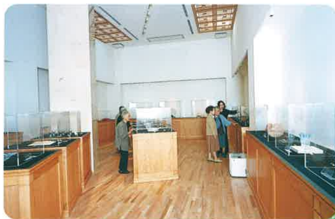
オークパーク・ギャラリー