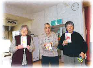
入所者様に制作をご協力頂いた抽選機で抽選会を実施