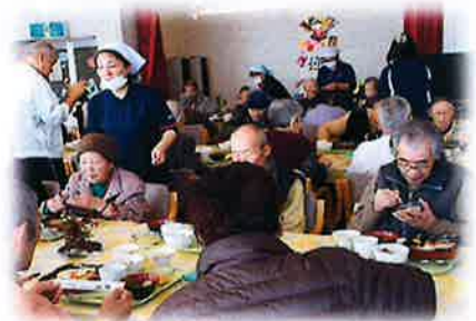
皆様と美味しく頂きました