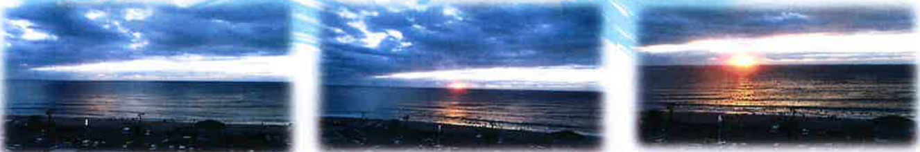
部原荘からの初日の出。雲が多い空模様でしたが、無事見ることが出来ました。