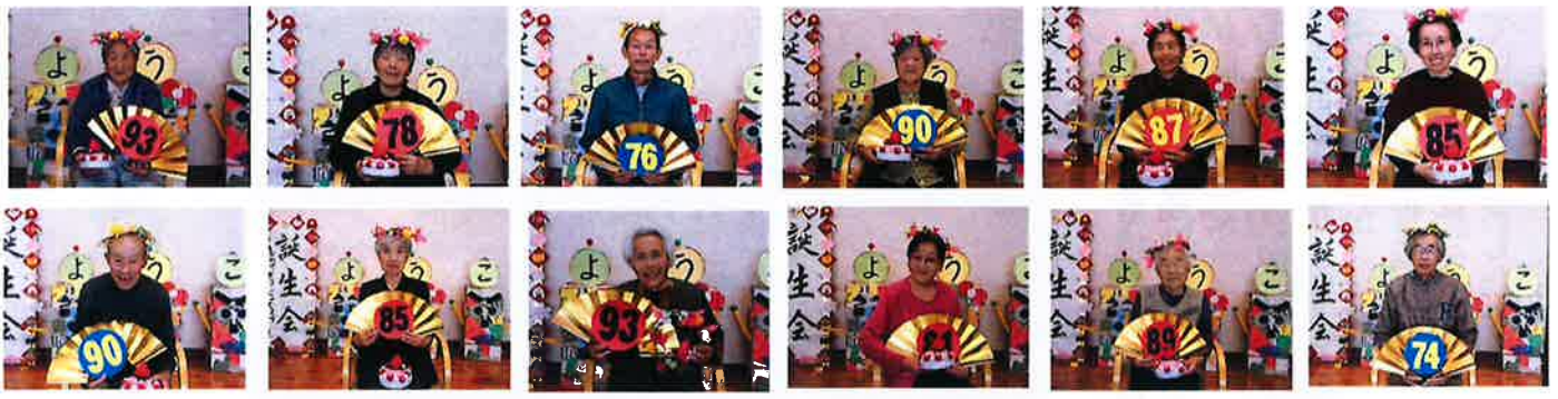
10、11月誕生者の皆様 11/6誕生会実施