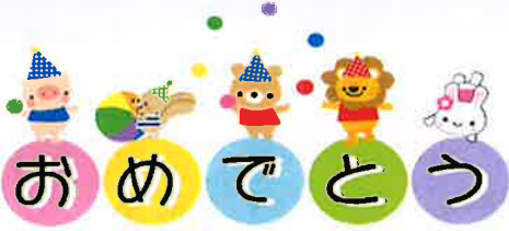
2、3月誕生者の皆様 3/7誕生会実施