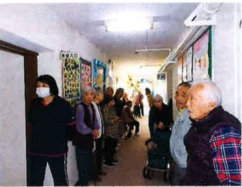
ふれあいの時間が待ちきれない様子！