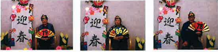
12、1月誕生者の皆様 1/10誕生会実施