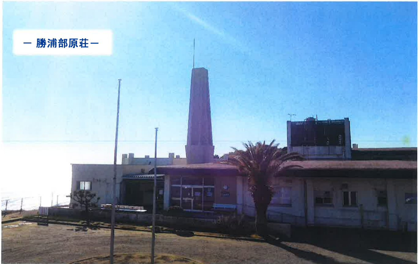
— 勝浦部原荘 —