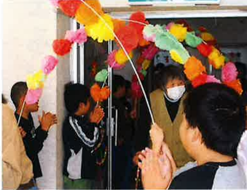
笑顔でのお出迎え