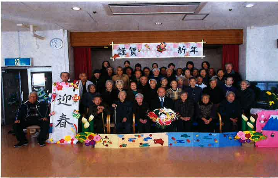
新年・恒例の記念写真

平成最後となる、節目の新年会を 1月4日(金)に開催いたしました。 記念撮影の後はお寿司や茶わん蒸 し、煮物をいただき、今年の健康と 安全を願いました。