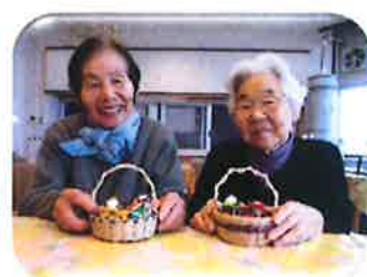
造花クラブの皆様、それぞれお雛様を作成されました。