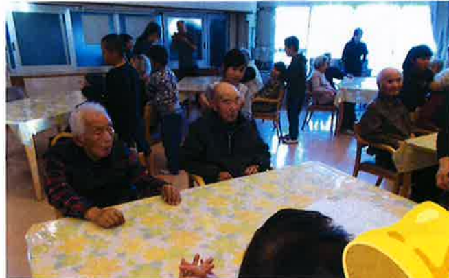
肩も気持ちもほぐれ楽しいひととき