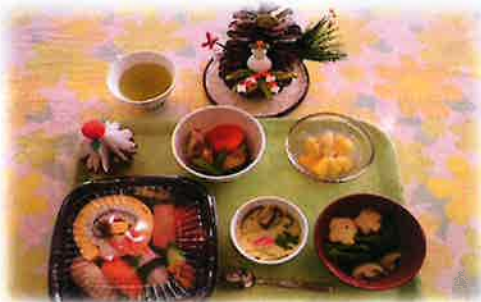
新年会恒例の握り寿司