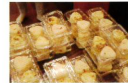
手作りのおにぎり