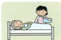
着替え・排泄の介助