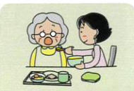
配膳・食事の介助