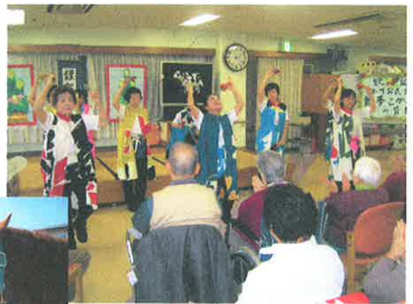
慰問の方からエネルギーを...