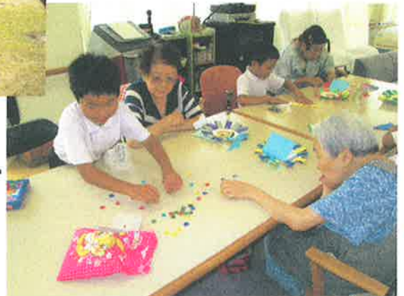
園児さんと一緒に昔遊び