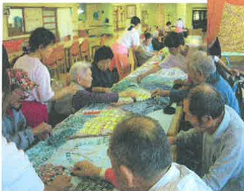
みんなと助け合って作品作り