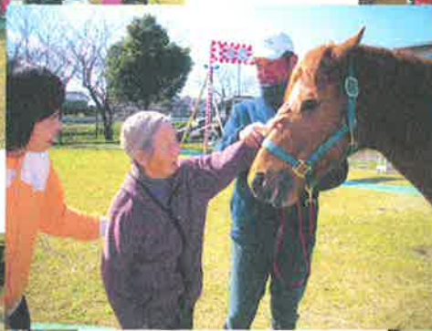
毎年、三月には ポニーがやってきます