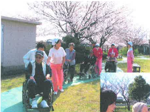
清々しいこんな日は中庭散歩