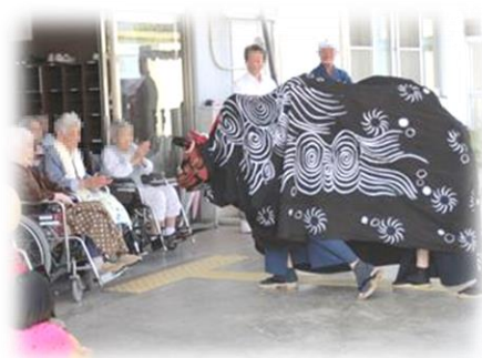
地域の方との交流会