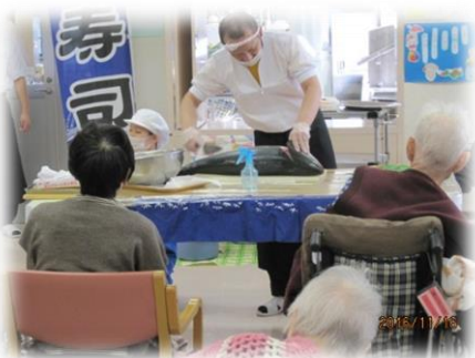
プリの解体ショー