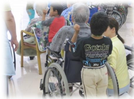
園児さんとの交流会