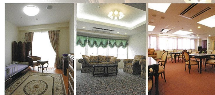
個室 サブリビング リビングダイニング