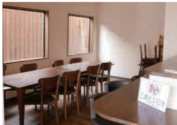
駐車場は数に限りがあります(4台)

【こまどぷらす】大分県中津市京町 1462 番地 6 (南部小学校体育館 隣) (京町やむちゃ隣)