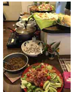
以前行われた「ぷらす食堂」の様子です

★要予約 予約・お問合せはこちらまで→ 15人限定 申し込み締め切り 7月20日まで