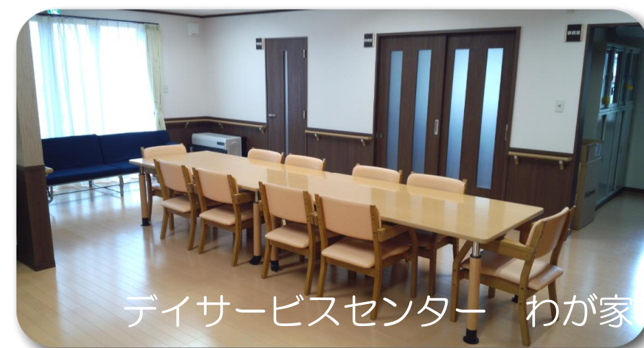
デイサービスセンター わが家

当施設の街路灯は、岩手県クリーンエネルギー導入支援事業の支援により設置されました。クリーンエネルギーの導入により、周辺環境の保全及び二酸化炭素の排出抑制に努めます。