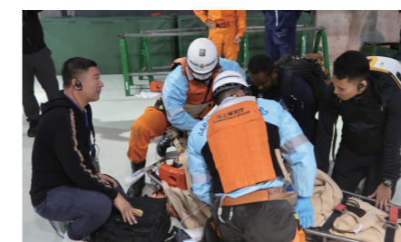
特殊救難隊との合同模擬訓練