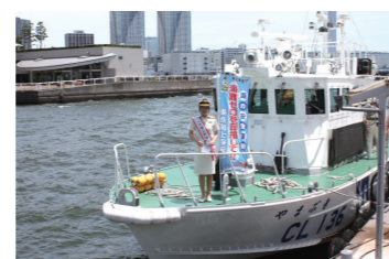
一日海上保安部長