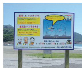
海浜事故防止啓発用立て看板