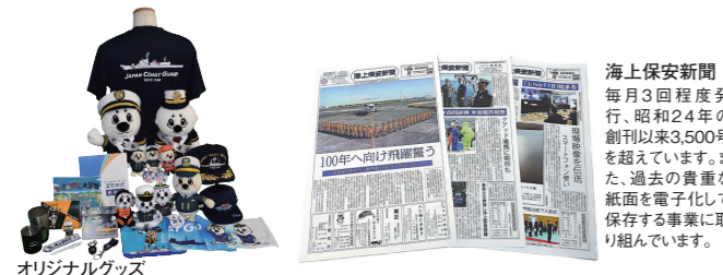
オリジナルグッズ

海上保安新聞 毎月3回程度発行、昭和24年の創刊以来3,500号を超えています。また、過去の貴重な紙面を電子化して保存する事業に取り組んでいます。