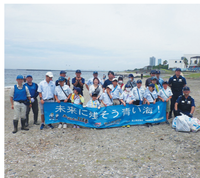
海上保安協力員による海浜等の清掃活動