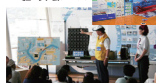
関門海峡での海上保安業務の説明