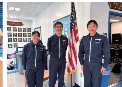
USCGA(米沿岸警備隊)研修