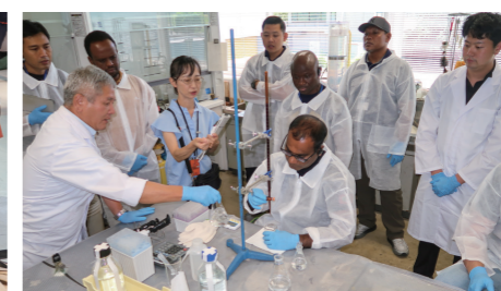
海上保安試験研究センターでの研修