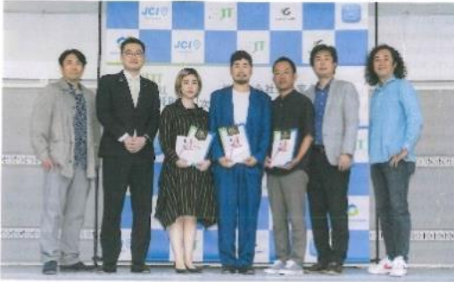
地方都市にイノベーションを巻き起こす。

2023年11月18日 浜松市山側と街側の両側から地方都市にイノベーションを巻き起こす。NEXT LOCAL LEADERS 浜松。山側と街側から地方都市にイノベーションを巻き起こす。NEXT LOCAL LEADERS 浜松。