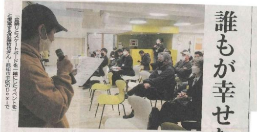
「誰かが幸せな「街中」を探る」の取材の様子。山側と街側の両側から地方都市にイノベーションを巻き起こす。