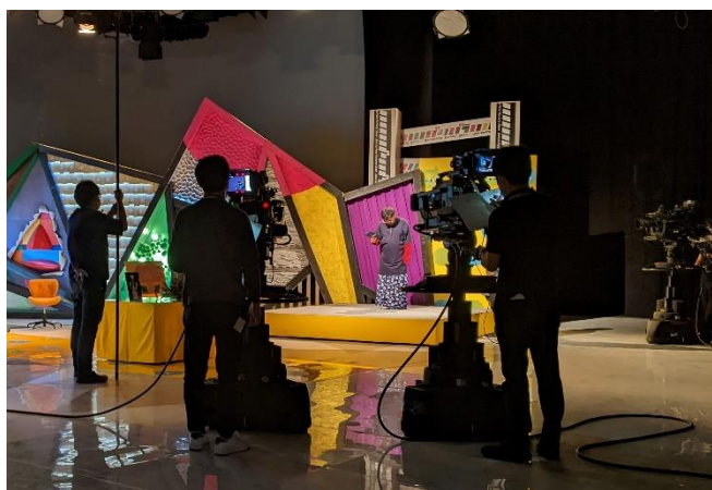
NHK E テレ(全国)「バリバラ」