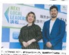
「NEXT LOCAL LEADERS 浜松」の受賞者たち。

「NEXT LOCAL LEADERS 浜松」は、山側と街側の両側から地方都市にイノベーションを巻き起こす。NEXT LOCAL LEADERS 浜松。山側と街側から地方都市にイノベーションを巻き起こす。NEXT LOCAL LEADERS 浜松。