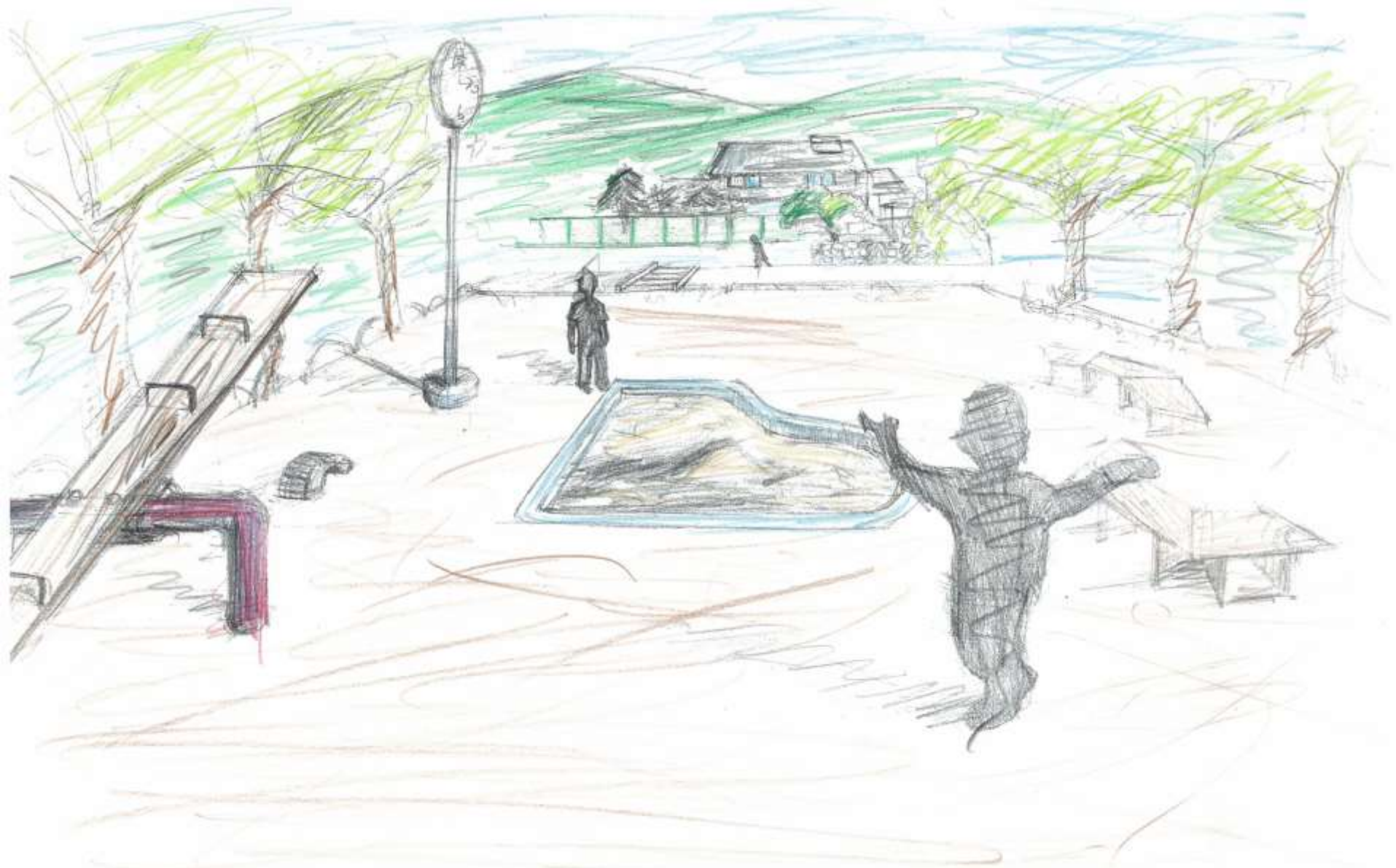
【大野地区 公園将来構想スケッチ】