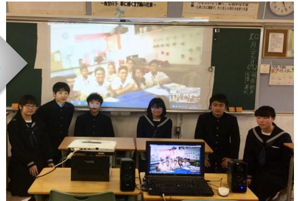
賛同参加 流山市立八木中学校 * 2017年度 東葛飾地域の高等学校に提案