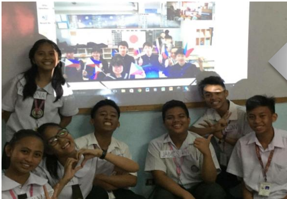
賛同参加 メトロマニラ ラスピーニャス市 インターナショナルハイスクール

2015年2月29日 流山市立八木中学校にて実施 対象国:フィリピン/インドネシア 大型プロジェクターとネット回線(スカイプ)で両国の学校をつなぐ国際交流プログラム