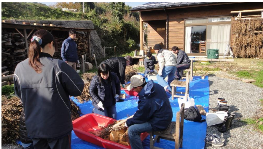
12月1日 大豆の収穫体験 脱穀作業(1)