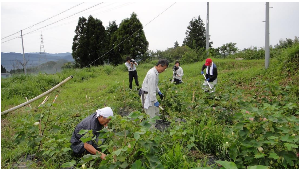
その後ひたすら草取り