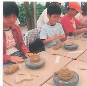
彩りフェスタ(10月)陶芸教室