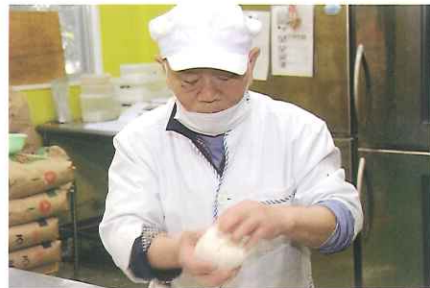
パンは「捏ね」から「焼きあげ」までを学べます

当施設では専門分野の技術を習得することが出来ます。訓練内容は陶芸（陶器製造）・食品加工（パン製造）・軽作業（下請け作業）に分かれており、個々の希望によって自由に選択することが出来ます。また、より実践的な職業訓練を希望する方には企業への就労体験も行っています。