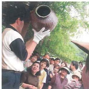
陶器まつり(5月)窯だしオークション

三彩の里では広く地域の方との交流と理解を深めていただくために年に2回のイベントを行います。5月GWには利用者の作品を展示・販売する“陶器まつり”、10月は地域交流を目的にした“彩りフェスタ”を開催しています。施設を一般公開し全利用者が日ごろ製作した作品の販売を中心にさまざまな催し物を行います。