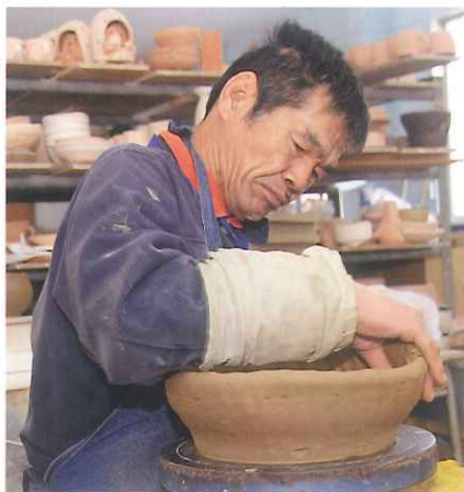
それぞれの能力に合わせた技法の習得が可能です