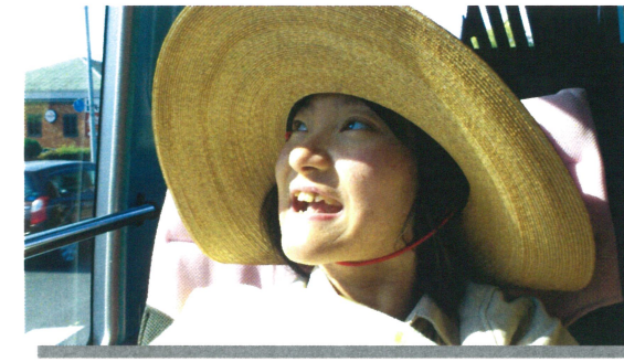
ドライブ活動・散策