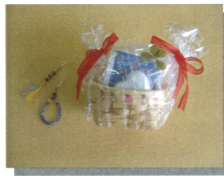
ビーズストラップ・入浴剤