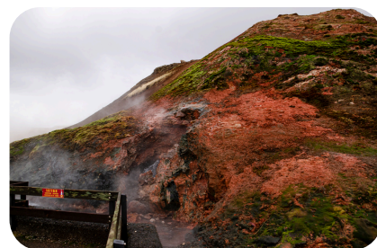
防災や啓発活動など

緑を失った山への植樹や清掃、山火事の恐ろしさを周りに伝える啓発活動。また被災者や消火にあたった消防士や消防団の中には鎮火後も続くと言われるメンタル不調へのケアなど、行政の手の届かない場所やニーズに対応し速やか且つ柔軟に復旧・復興に繋げていきます。