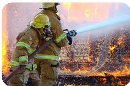
被災者、関係者への メンタルケアなど