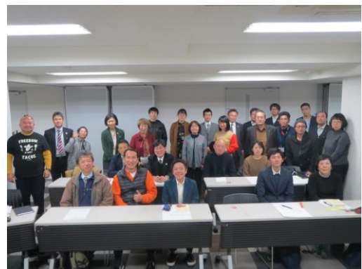
「SDGs ネットワークおかやま」設立総会の様子