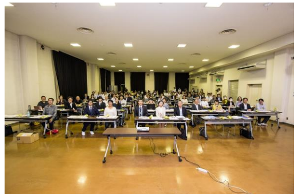
「災害支援ネットワークおかやま」設立総会の様子

皆様から「あってよかった」「助かった」と言われる支援組織となるために、これからも質の高い連携・協働を心がけて各事業を推進してまいります。