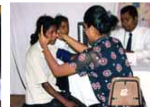
村人への診断と治療