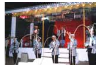
柏マジックショー