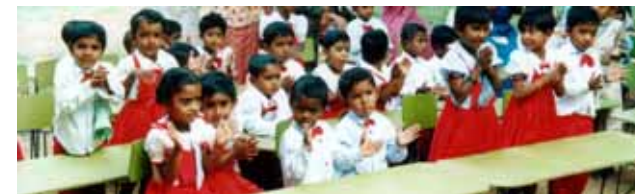
幼稚園の子ども達