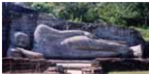
ポロンナルワ古代遺跡、この涅槃仏から徒歩 10 分の所に 2004 年 2 月に開校予定の第 4 の幼稚園を建設中。

『憎悪は憎悪によって止むことなく、愛によって止む ~ Hatred ceases not by hatred, but by love. ~』 故ジャヤワルダナ大統領は、お釈迦様の言葉を引用し、1951 年 9 月、サンフランシスコ対日講和会議にて対日賠償請求権を放棄するよう求め、「日本は真に自由で独立した国でなければ」と、参加国に寛容の精神を求めた事から、友好関係が始まりました。それ以来 50 年の国交関係をもつ日本と、スリランカ。今こそ、スリランカへの支援を通して真に友好を築く関係でありたいと願います。