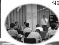
ミニ分科会 (擬似円卓)